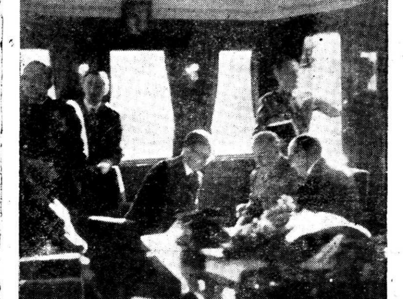
El Caudillo en el tren especial que inauguró el ferrocarril de La Coruña a Santiago de Compostela.